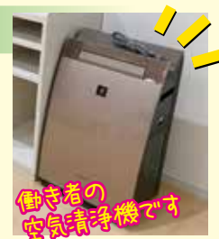
働き者の空気清浄機です

お預かりしたお子さまが主に過ごされるお部屋です。広々とした構造であり、フロアシートにはクッション性の高い緩衝マットが使われております。さらに床暖房も完備されておりますので冬でもホコリを気にせず温かく過ごせます（観察室も同様です）。