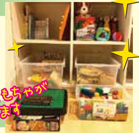
魅惑のおもちゃが待っています

各部屋につながっているために他の部屋を通らずに行ける構造となっております。また、吐物や下痢がひどくて着替えが必要なお子さまのためにシャワー室としても利用できます。