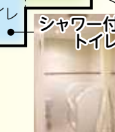
シャワー付トイレ